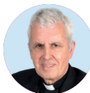
† Luis Quinteiro Fiuza Obispo de Tui-Vigo

Para seguir haciendo el camino de la Iglesia en nuestra diócesis de Tui-Vigo deseamos seguir contando contigo, porque tenemos claro que “somos lo que tú nos ayudas a ser”.