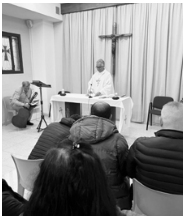
FOTO.- Eucaristía presidida por el obispo de Tui-Vigo en el Centro Penitenciario de A Lama (septiembre 2024)