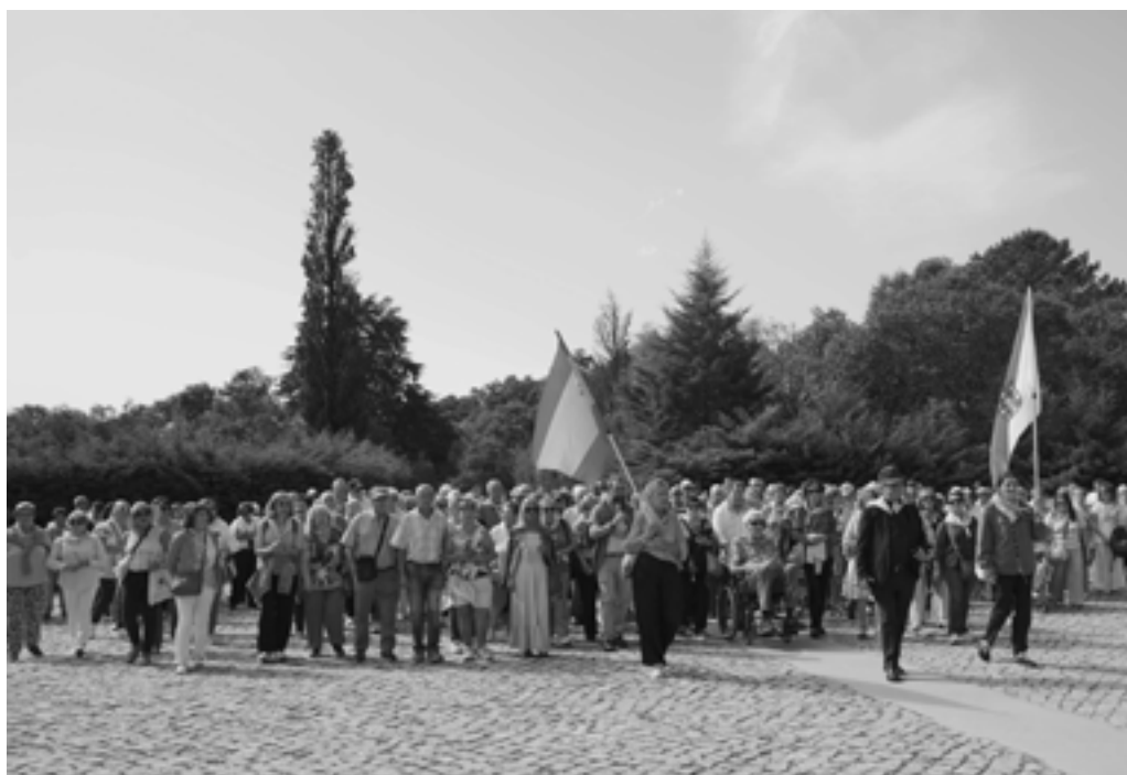
FOTO.- Peregrinación diocesana al santuario luso de Fátima (septiembre 2025)

La idea es ir en el mes de diciembre, a finales. Pero, dicha programación en este momento no se puede dar. En cuanto se tenga, se hará llegar lo antes posible.