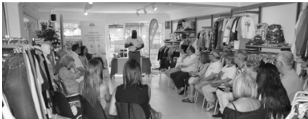
FOTO.- Actividad en la tienda Moda Re- de Cáritas, con motivo de la Semana de la Caridad (junio 2025)