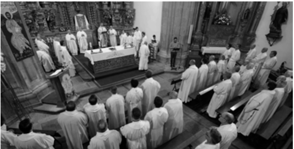
FOTO.- Celebración de la consagración del Seminario al Sagrado Corazón y aniversarios sacerdotales en Tui (mayo de 2025)