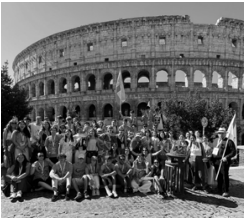
FOTO.- Jóvenes de la diócesis de Tui-Vigo participantes en el Jubileo de la Juventud (agosto 2025)