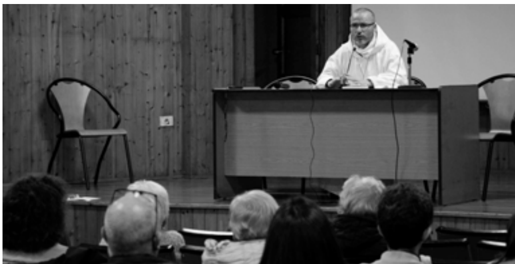
FOTO.- Conferencia durante la Semana de Apostolado Seglar (mayo 2024)