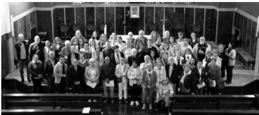
FOTO.- Participantes en «Ágora: escuela de formación teológica, ministerios y servicios» (abril 2024)